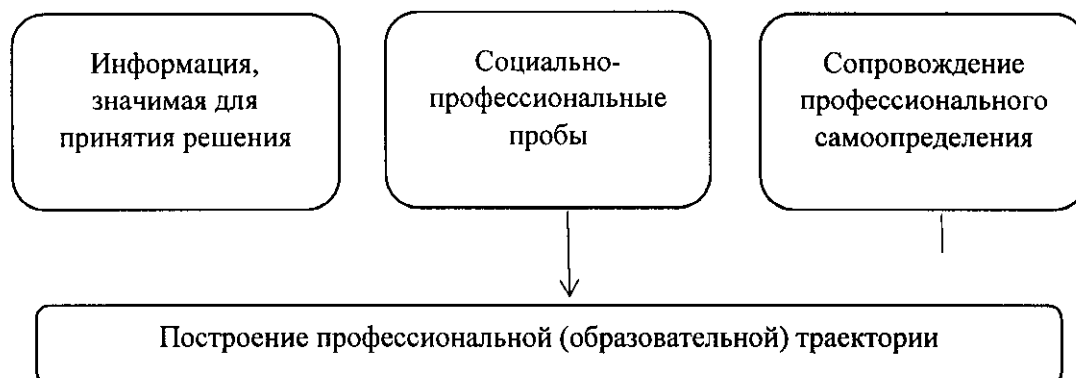
Рис. 1. Элементы профессиональной ориентации, обеспечивающие построение субъектом профессионального самоопределения профессиональной (образовательной) траектории

доступа субъектов профессионального самоопределения к качественному и разнообразному содержанию элементов профессиональной ориентации (см. рис. 1).