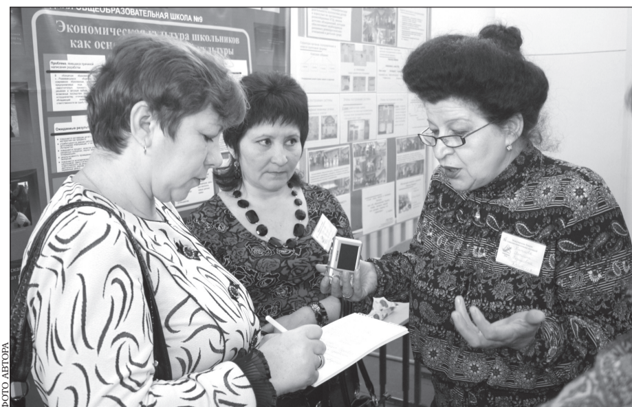
Обсуждая содержание и стоимость проектов, участники Ярмарки делятся опытом.