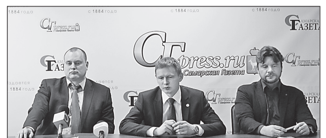
Достижения самарских учёных