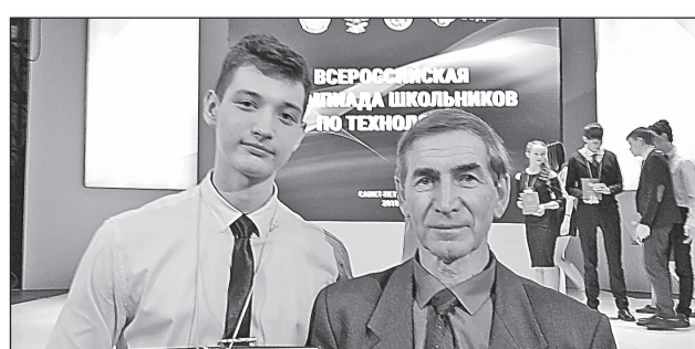
Учитель с большой буквы