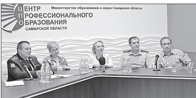
Лето - это маленькая жизнь