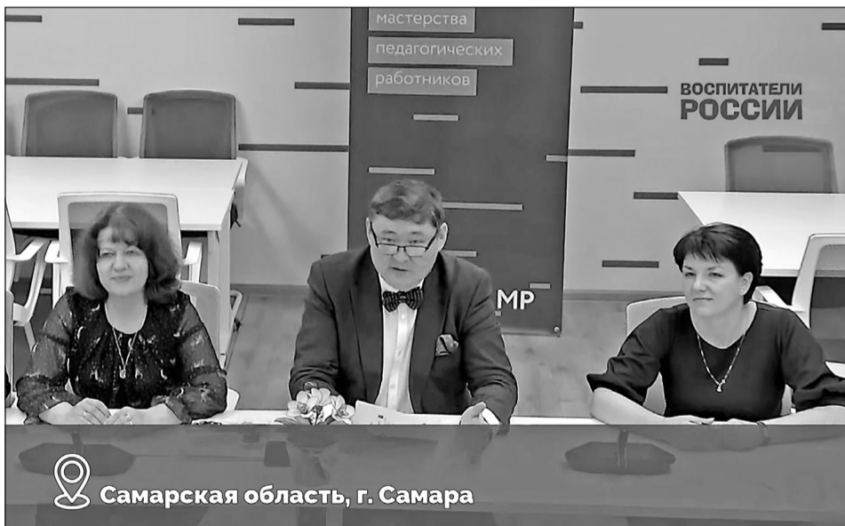
Самарская область, г. Самара